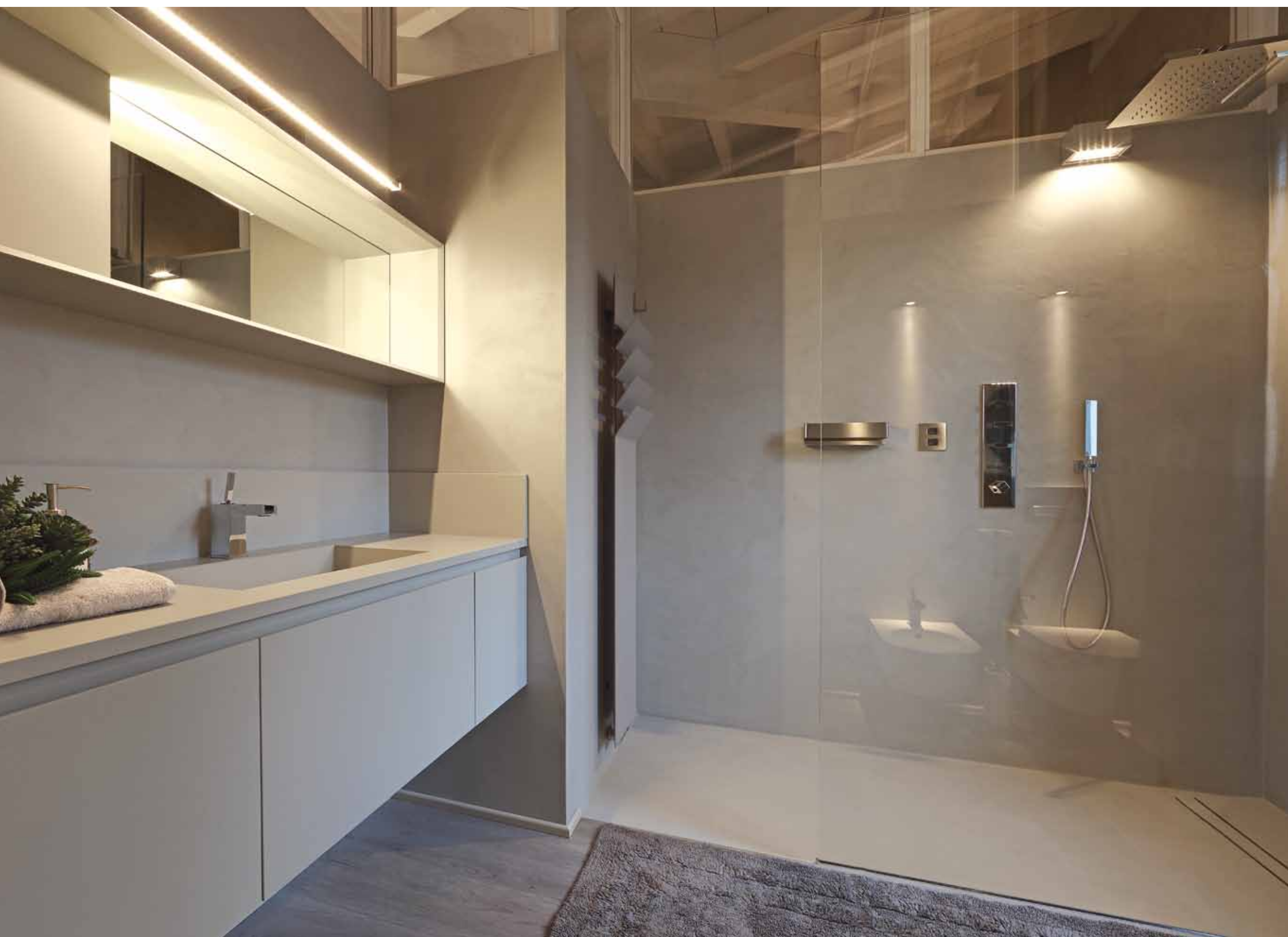
Le scelte minimaliste influenzano la composizione del bagno padronale, realizzato in kerlite e organizzato in uno spazio integrato all'adiacente camera da letto. Le tonalità scelte sono neutre, in linea con il rivestimento in resina della doccia (Turra Arredamenti).