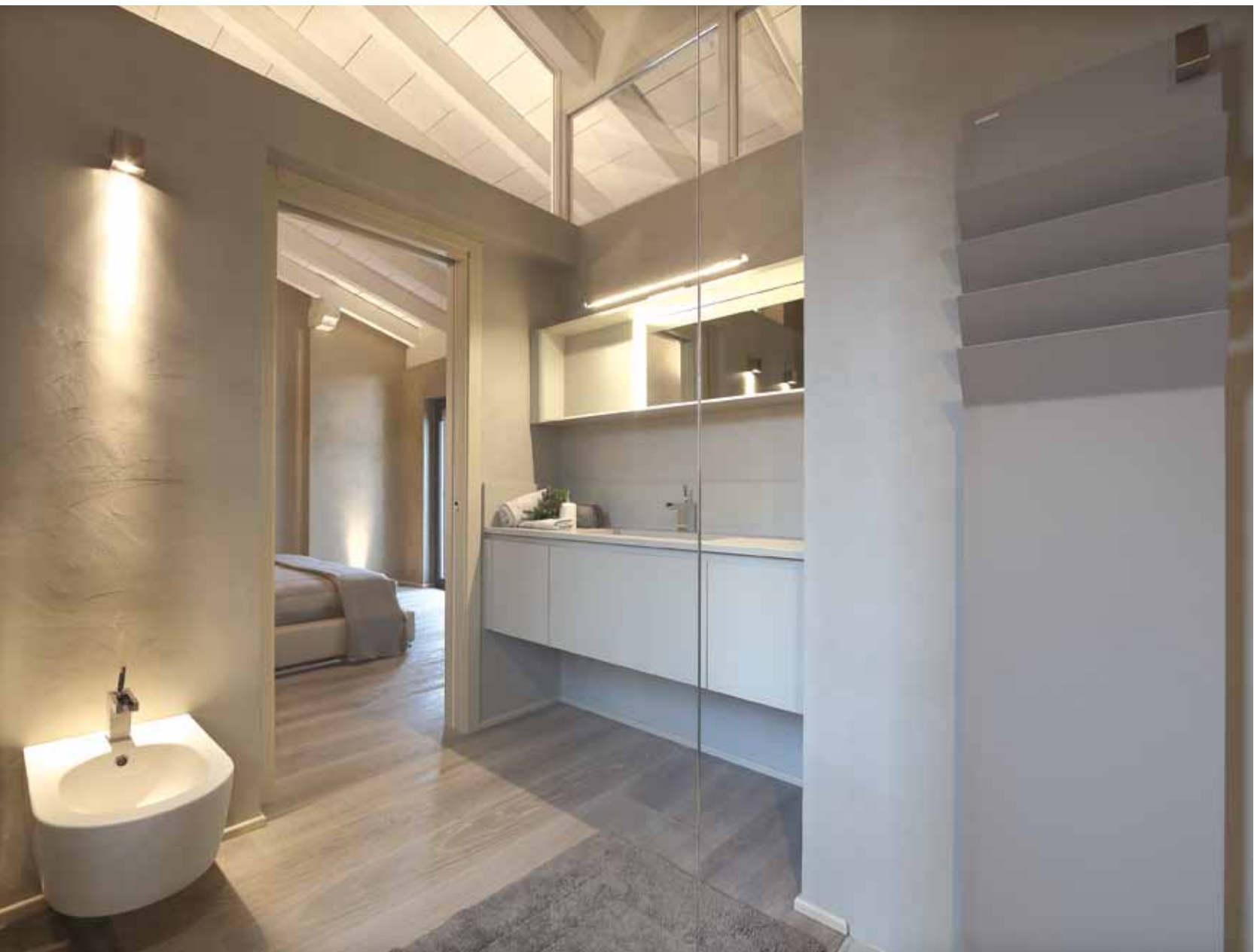
L'inquadratura prospettica dalla sala da bagno evidenzia il concept progettuale della dimora: il minimalismo compositivo incontra la delicatezza cromatica (Turra Arredamenti).